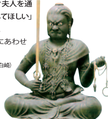
▲佐々木不動明王坐像 13世紀(鎌倉時代)