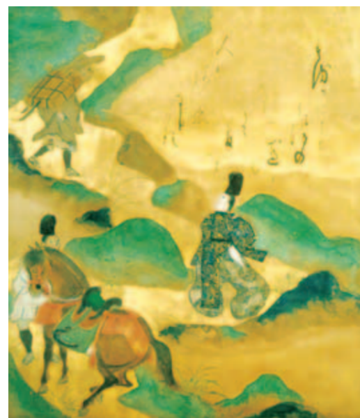
▲伊勢物語図色紙(依羅宗達) 17世紀(江戸時代)

甲賀市のMIHO MUSEUMでは「ニューヨーク・パーク・コレクション展」と題した春季特別展を開催中(6月11日まで)。パーク・コレクションとは、アメリカのマリー・パーク女史が第二次世界大戦後に集めた日本美術・工芸品のことであり、在外日本美術コレクションの中でも世界有数の質と量を誇るものとして知られている。