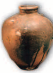
▲信楽大甕 15世紀(室町時代)